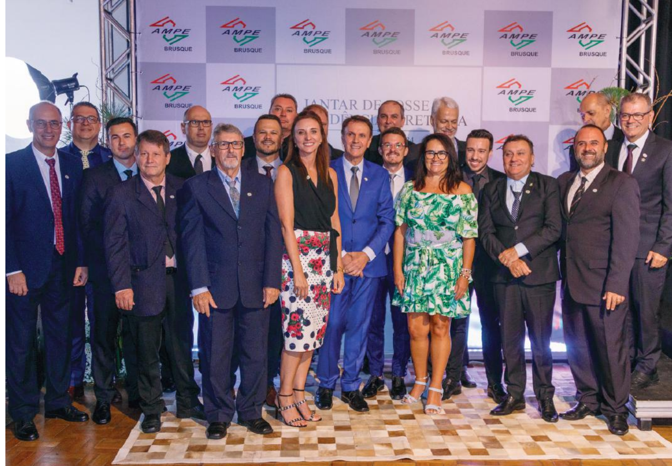
A diretoria da AmpeBr gestão 2023-2024

Em seu discurso, o novo presidente da AmpeBr também relembrou sua trajetória como empresário de confecção, a evolução da Pronegocio, bem como o potencial das micro e pequenas empresas. “Hoje, as micro e pequenas empre-