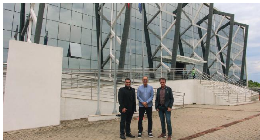
Os diretores da AmpeBr conheceram também Instituto SENAI de Sistemas Embarcados