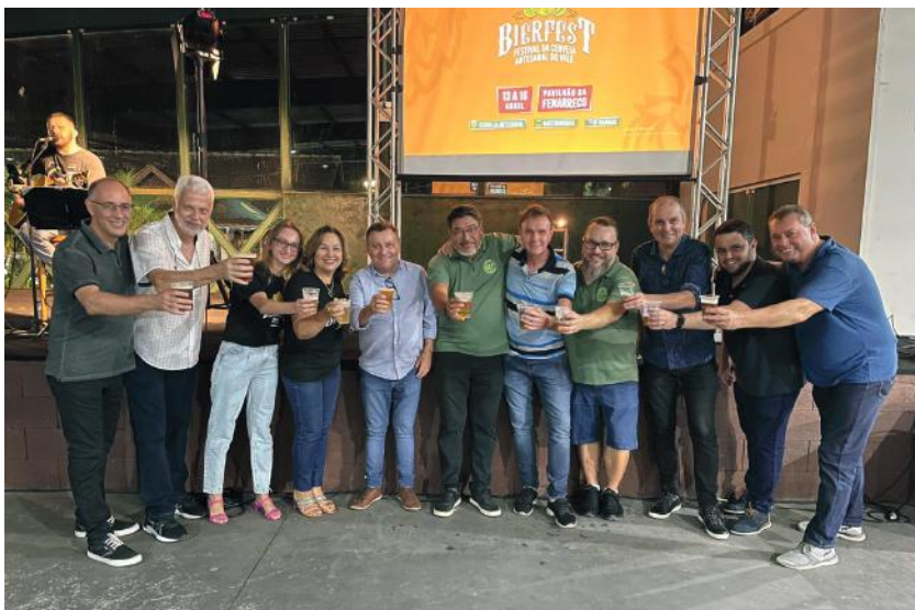
O Festival da Cerveja Artesanal do Vale acontecerá de 13 a 16 de abril, no Pavilhão da Fenarreco