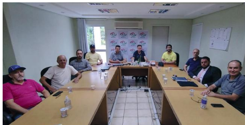
O encontro foi realizado na sede da AmpeBr e os vereadores conheceram mais alguns projetos e ações da entidade

“A visita foi muito positiva. Aproveitamos para trocar algumas ideias para projetos futuros e nos aproximarmos do poder Legislativo municipal. Agradecemos a visita dos vereadores e ficamos à disposição, da mesma forma, no que for possível contribuir”, comentou Schoening.