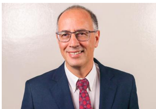
DIRETOR DO COMÉRCIO NACIONAL E INTERNACIONAL: CARLOS ALBERTO GRÃO VELLOSO