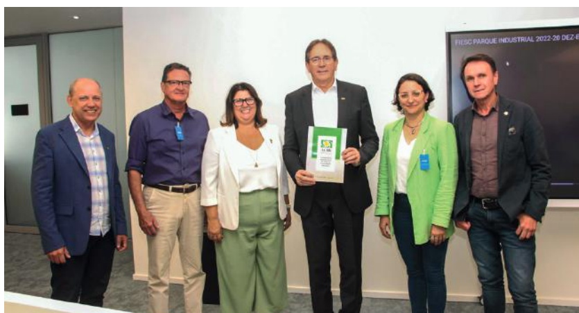
Na oportunidade, a presidente da ACIBr e os presidentes da AmpeBr, Sindivest e Sifitec fizeram a entrega de um ofício ao presidente da FIESC, com alguns pleitos, em prol de bandeiras da região